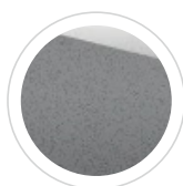
Solar Silver 600