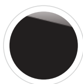
Agate Black 600