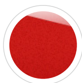
Fantastic Red 600