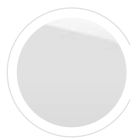
Frozen White 270