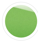
Mean Green (samo na ST) 860