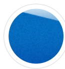
Desert Island 730